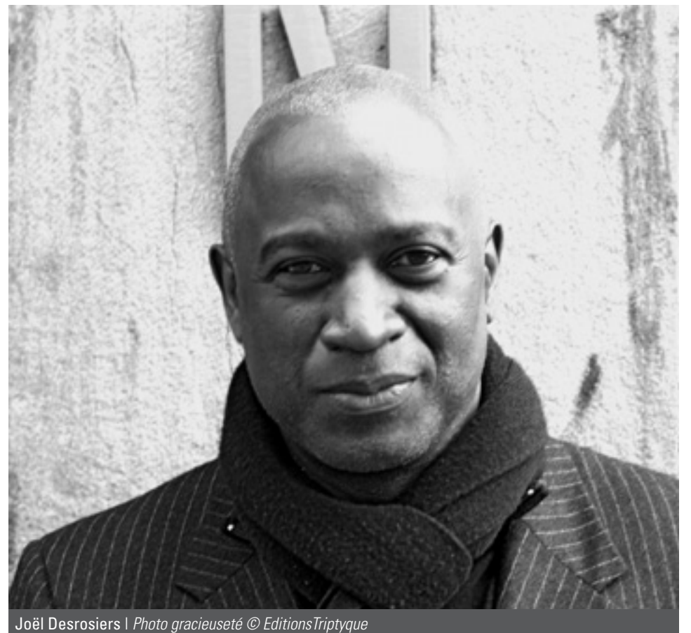
Joël Desrosiers