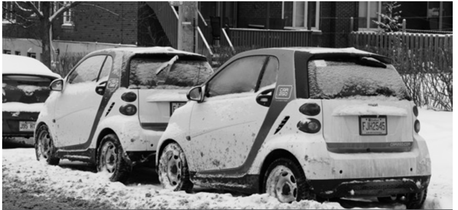
Les Car2Go prennent trop de place sur Hudson, se plaignent les riverains | Photo : Marie Cicchini

L'arrondissement a tenu une partie de ses promesses en leur accordant un permis