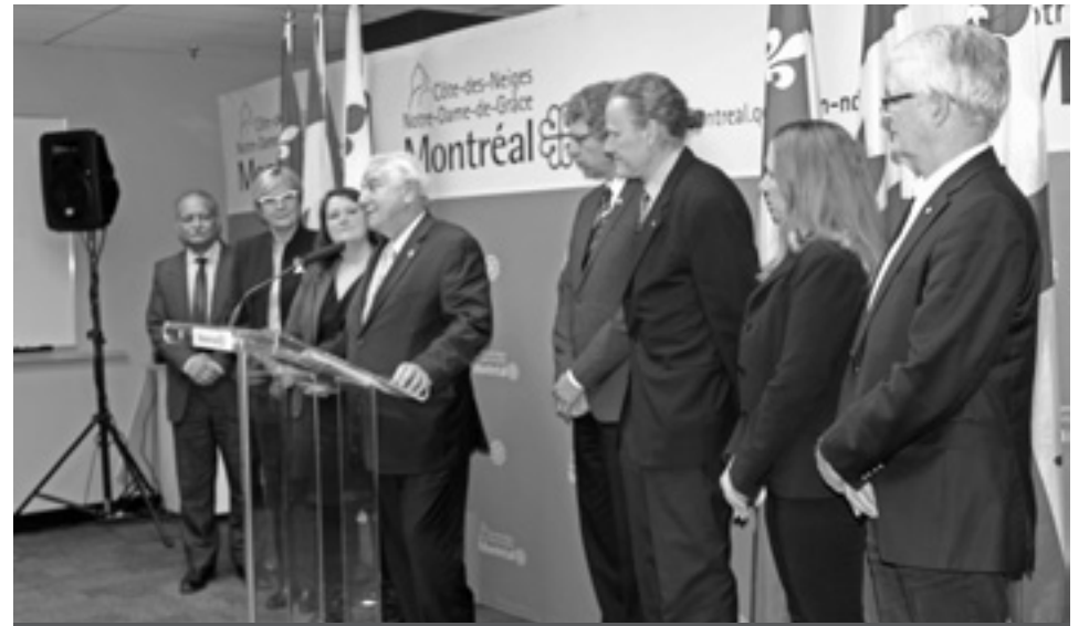
Plusieurs élus intergouvernementaux et des commissions scolaires ont pris la parole à la conférence de presse